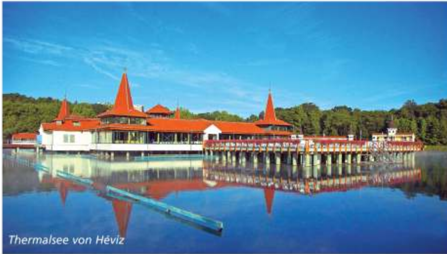
Thermalsee von Héviz