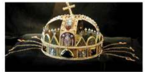
Schatzkammer mit Krone