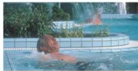
Aussenbad in Danubius Hotel Bük