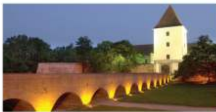
Burg in Sárvár bei Nacht