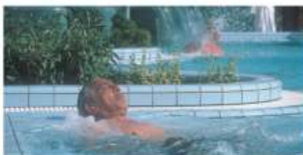
Aussenbad in Danubius Hotel Bük