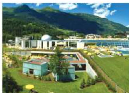
Die Alpen Therme Gastein in Bad Hofgastein

STATION IV Entfernung v. Stollenportal 2238 m Temperatur + 41,5°C