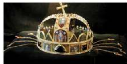
Schatzkammer mit Krone