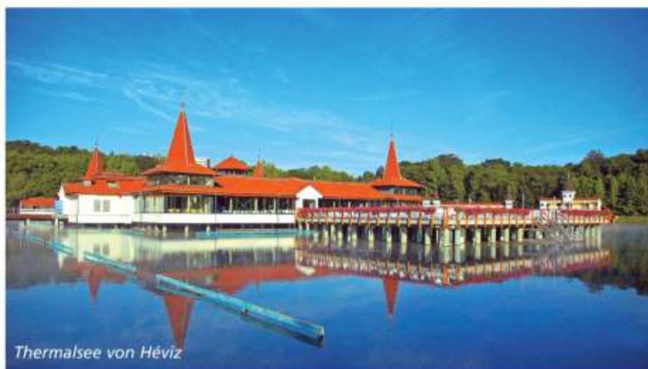
Thermalsee von Héviz