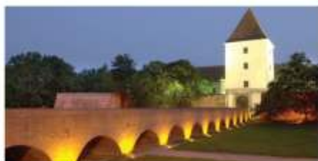
Burg in Sárvár bei Nacht