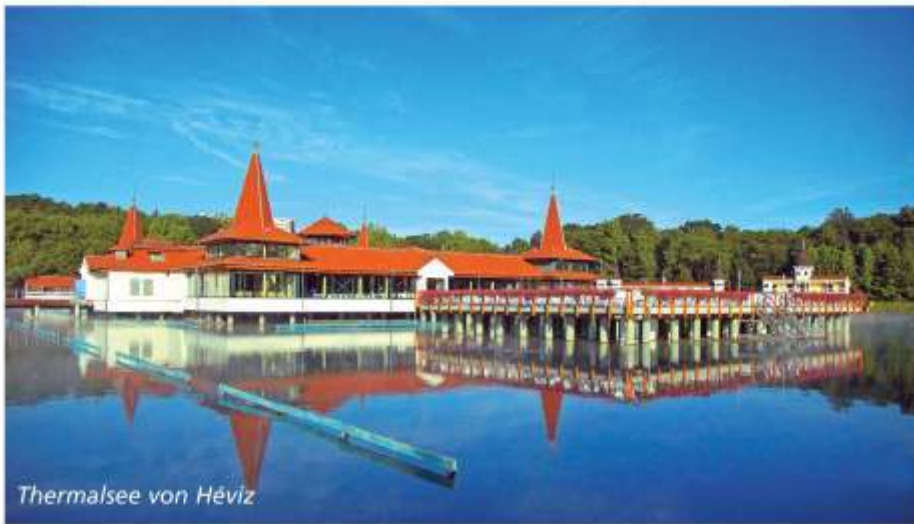
Thermalsee von Hévíz