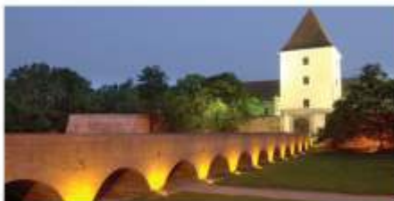
Burg in Sárvár bei Nacht