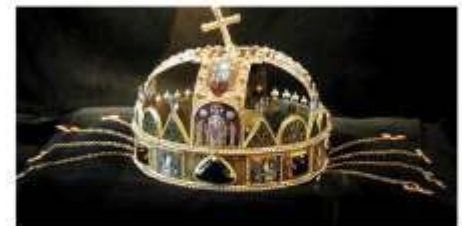
Schatzkammer mit Krone