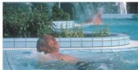
Aussenbad in Danubius Hotel Bük