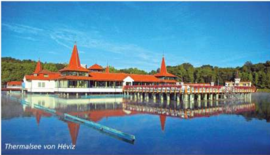
Thermalsee von Héviz