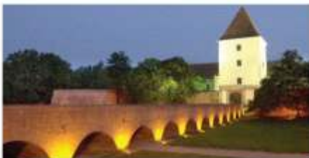
Burg in Sárovar bei Nacht