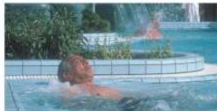
Aussenbad in Danubius Hotel Bük