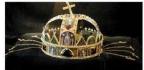
Schatzkammer mit Krone